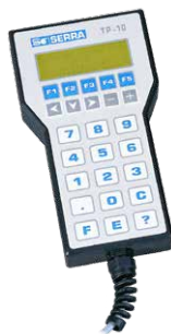
TP-10 HORDOZHATÓ PROGRAMOZÓTERMINÁL