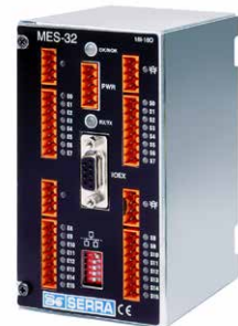
MES-32 BŐVÍTŐ MODUL