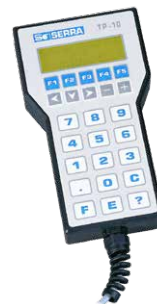
TP-10 HORDOZHATÓ PROGRAMOZÓTERMINÁL