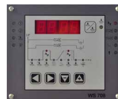
WS 708 VEZÉRLŐEGYSÉG