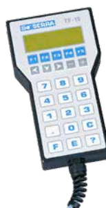
TP-10 HORDOZHATÓ PROGRAMOZÓTERMINÁL